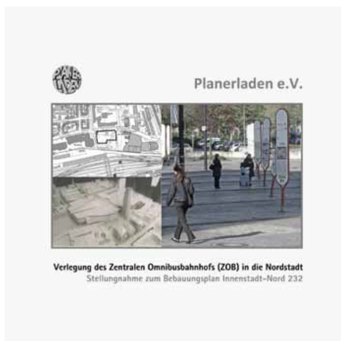
Abb. 4: Deckblatt Broschüre

Insbesondere wurde argumentiert, dass mit der Verlagerung des ZOB in die Nordstadt die Ziele und Erneuerungsimpulse der bereits beschlossenen Konzepte und in der Vergangenheit verfolgten Handlungsprogramme konterkariert und entwertet werden. Durch die kritischen Nachfragen und Einwürfe seitens des Planerladen im Rahmen der Veranstaltung wurde mehr als deutlich, dass bei der Suche nach Ersatzstandorten und der Eignungsbewertung verkehrsfunktionale Gesichtspunkte oben angestanden hatten, während hingegen die Schutzgüter Mensch, Umwelt und Städtebau vernachlässigt worden waren. Die Perspektive der Anwohner aus den angrenzenden Quartieren kam hingegen gar nicht vor. Nach einem erneuten Plädoyer eines Vertreters des Planerladen in der üblichen Bürgersprechstunde vor der entscheidenden Bezirksvertretungssitzung im Juli 2011 entschied zwar auch das Stadtbezirks-gremium mehrheitlich gegen den vorgelegten Planentwurf, es wurde aber anschließend durch eine entsprechende Ratsmehrheit überstimmt.