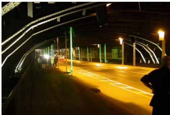
Abb. 7: Gefördertes Projekt: Aktion „Statt Angstloch Tore in die Nordstadt“

formiert hatte. Diese sahen dadurch offenbar ihre ohnehin schwache Entscheidungsmacht noch zusätzlich geschmälert. Dabei handelt es sich um eine Reaktionsform, die im Übrigen auch in anderen Programmgebieten der „Sozialen Stadt“ beobachtet werden kann (vgl. auch Difu 2003, S. 21).