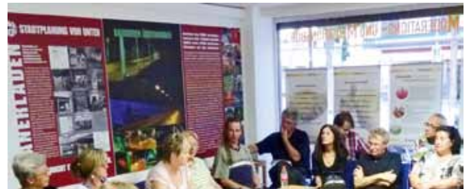
Abb. 3: Nachbarschaftsforum Grillen

Der Planerladen lud daraufhin im Juli 2011 erneut zu einem Bürgerforum ein, bei dem sich mehrheitlich Bewohner mit Migrationshintergrund einfanden. Geradezu empört zeigten sich einige Anwesende, dass das legitime Interesse von Stadtteilbewohnern, darunter viele Familien, am gemeinsamen Grillen mit Freunden oder Nachbarn ignoriert wird, und diese in einem Stadtteil mit über 50.000 Einwohnern auf drei Grillstationen verwiesen werden. Eine türkische Bewohnerin merkte mit verständlichem Zynismus an: „Verstehe ich das richtig? Grillen ist also wie Prostitution?“ Weder der Freundeskreis Fredenbaumpark noch Politik und Verwaltung hatten den Versuch unternommen, im Vorfeld auch mit den verschiedenen Migrantengruppen über die geplanten ordnungsrechtlichen Interventionen zu reden, um im Sinne einer Abwägung deren Nutzungsinteressen zu erfassen. Der Ordnungsdezernent hat jetzt ein stadtweites Konzept für das Grillen an zwölf verschiedenen Standorten angekündigt.