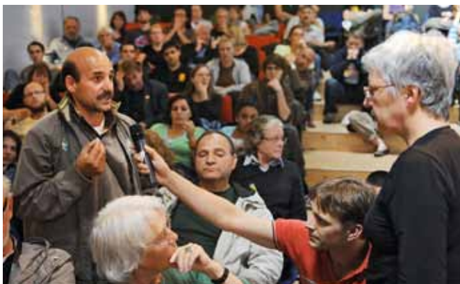
Abb. 5: Depot-Veranstaltung

Zwar war dies nur ein erster Schritt; allerdings ging davon eine nicht zu unterschätzende Symbolwirkung aus – dies insbesondere angesichts eines politischen Klimas, bei dem nicht nur in seiner medialen Inszenierung, sondern vor allem in der konkreten politischen Auseinandersetzung im Stadtteil das Sündenbockprinzip exerziert wird und Entsolidarisierungstaktiken sowie der populistische Ruf nach „Zero Tolerance“ vorherrschen. Der Planerladen trieb mit mehreren Organisationen (darunter auch der Mieterverein und bodo) in der Folge die Gründung des „freundeskreises für nEUBürger und roma“ voran.