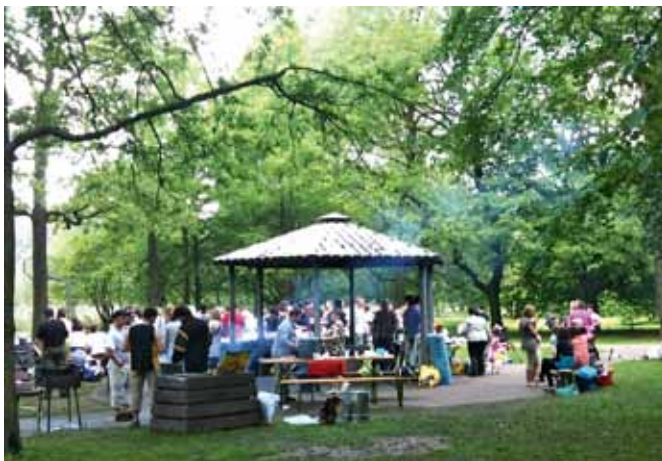
Abb. 2a und 2b: Grillen im Park

Der Planerladen war von verschiedenen Seiten auf diesen Konflikt aufmerksam gemacht worden und hatte sich neben vermittelnden Gesprächen mit Stadtgrün und dem Bezirksbürgermeister zugleich darum bemüht, dass dabei auch die betroffenen Nutzer zu Wort kommen. Dies geschah insbesondere