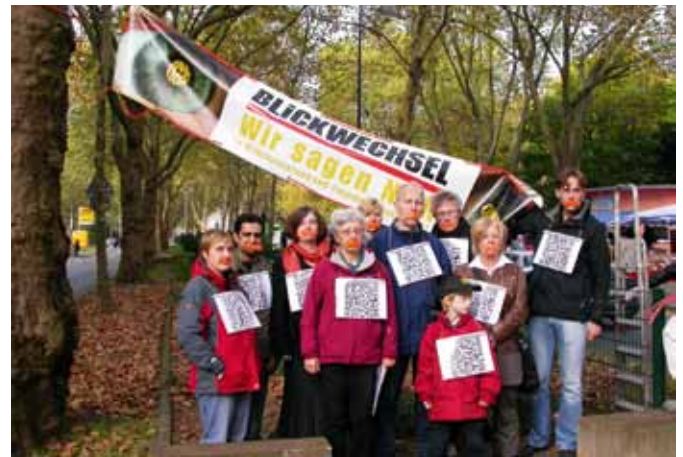
Abb. 6: Protest gegen zensorischen Eingriff

In Verbindung mit den Aktionsfonds (später Fonds für bewohnerschaftliche Projekte) wurden nach mehrjähriger Überzeu-